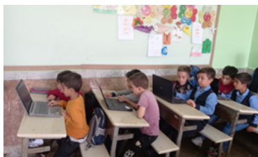
شکل ۱- دانش آموزان در حال انجام بازی

بازی دیجیتال در طی دو جلسه در یک هفته برای گروه های آزمایش اجرا گردید و دانش آموزان گروه کنترل آموزش را از طریق روش مرسوم توسط معلم دریافت نمودند. هدف آموزشی این درس جمع کردن اعداد تک رقمی بود. برای رسیدن به این هدف ابتدا با دانش آموزان صحبت شد که امروز قرار است جمع کردن اعداد را با هم یاد بگیریم ولی این موضوع را با انجام یک بازی یاد خواهیم گرفت. لازم به ذکر است که قبل از اجرای بازی پیش آزمون از دانش آموزان گرفته شد و سپس تجهیزات مورد نیاز برای اجرای بازی تهیه و به کلاس آورده شد، سپس دانش آموزان با کمک معلم برنامه بازی را باز کرده و فعالیت اجرای بازی را شروع کردند. معلم دانش آموزان را جهت تعامل بهتر با بازی و آشنایی با قواعد آن راهنمایی می کرد و همچنین در هر موردی که دانش آموزان با مشکل مواجه شده یا سوالی داشتند معلم کلاس پاسخ داده و راهنمایی می کرد. در انتهای جلسه دوم که فعالیت انجام بازی پایان یافت پس آزمون یادگیری، درگیری تحصیلی و انتقال یادگیری اجرا گردید و داده های مورد نیاز جمع آوری شدند.